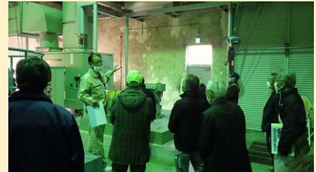
梅田ポンプ場見学