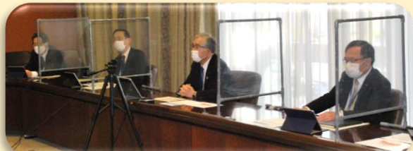
市役所での会議の様子(市長等)