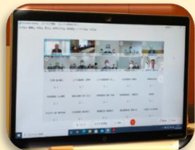
ネット懇談会の様子

また、「新しい生活様式」に対応した町内会活動としては、共通のチェックシートを作成して実施している百歳体操や、往復はがきによる高齢者の安否確認、新しい生活様式の周知活動、会議の書面開催や分散開催など、新型コロナウイルス感染防止対策をしながら町内会活動に取り組んでいる状況を共有することができました。