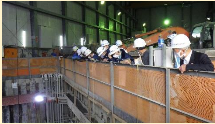
赤木貯留管工事現場見学