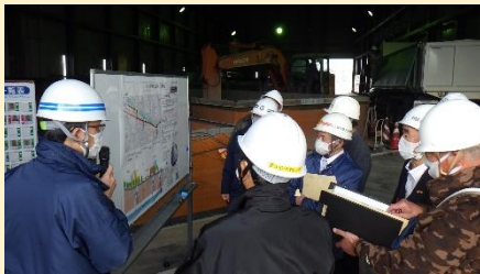
赤木貯留管概要説明

梅田ポンプ場では、雨水ポンプ場の役割や、施設の概要、昨年の東日本台風時の状況などについて説明を受けました。